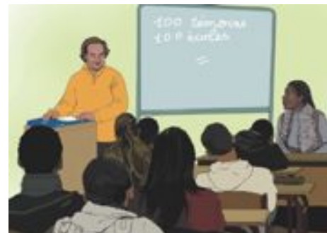
© Paroles d'hommes et de femmes